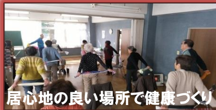
居心地の良い場所で健康づくり